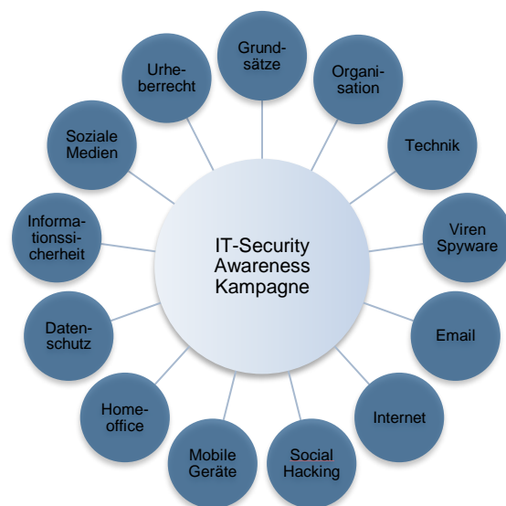
Themengebiete der IT-Security Awareness Kampagne

Die IT-Security Spezialisten von United Security Providers erstellen mit Ihnen gemeinsam eine detaillierte Kampagnenplanung. In einer ersten Phase werden Inhalt, Umfang, Zielpublikum und Schulungskanäle definiert. Dabei gilt es die zu adressierenden Themengebiete, Massnahmen und Aktionen nach Ihren Bedürfnissen festzulegen. Im Anschluss wird ein Ablaufplan erstellt, welcher die logischen Abhängigkeiten des Vorhabens festlegt und die Basis für eine detaillierte Kostenplanung bildet.