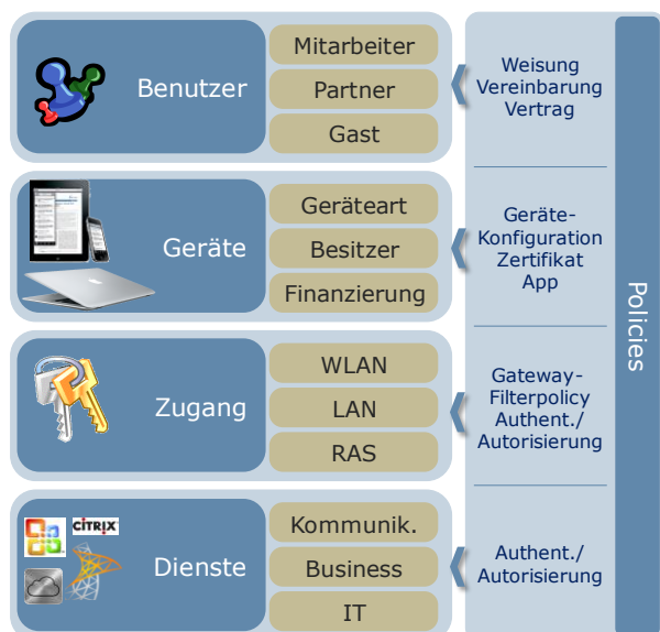
Die fünf strategischen Dimensionen im Thema BYOD

Dem Mitarbeiter die Beschaffung und den Betrieb der Arbeitsmittel wie Smartphones und Tablets oder gar Laptops zu überlassen, verspricht auf den ersten Blick willkommene Kosteneinsparungen. Die durch die Typenvielfalt entstehenden Supportkosten und Ineffizienzen können diese Einsparungen aber schnell wieder wettmachen. Eine positive Bilanz zu schaffen, bedarf einer genauen Betrachtung der verschiedenen Finanzierungsmodelle. Je nach Unternehmen und Belegschaft sind Aspekte wie Typenvielfalt und Kostenaufteilung unterschiedlich zu bewerten. Um die effiziente Nutzung der Lösung zu gewährleisten, empfiehlt es sich, rechtzeitig eine leistungsfähige Supportorganisation bereit zu stellen.